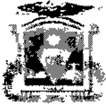
CUADRO N° 08