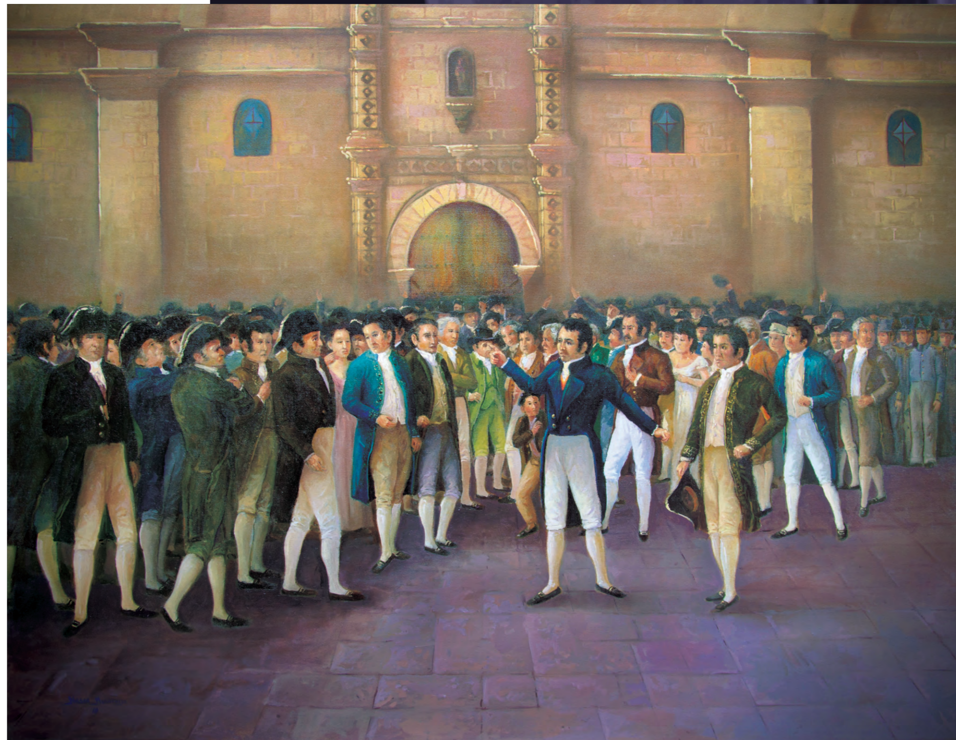
Primera Proclama de la Independencia Nilson Mogrovejo Marroquín Óleo de 130 x 100 cm

La gesta patriótica de Moquegua le valió para que sea elevada a rango de ciudad, en 1823, nueve años después; como inferencia de las efemérides de las batallas de Moquegua y Torata, el Congreso Constituyente del Perú presidido por don José Hipólito Unanue y Pavón la declara como tal "en consideración que la villa de Moquegua, proclamó espontáneamente su independencia, luego que en el año 1814, se presentó la oportunidad. Y que muchos de sus nobles hijos, han dado apreciables testimonios de su valor y constancia en defensa de las libertades del Perú".