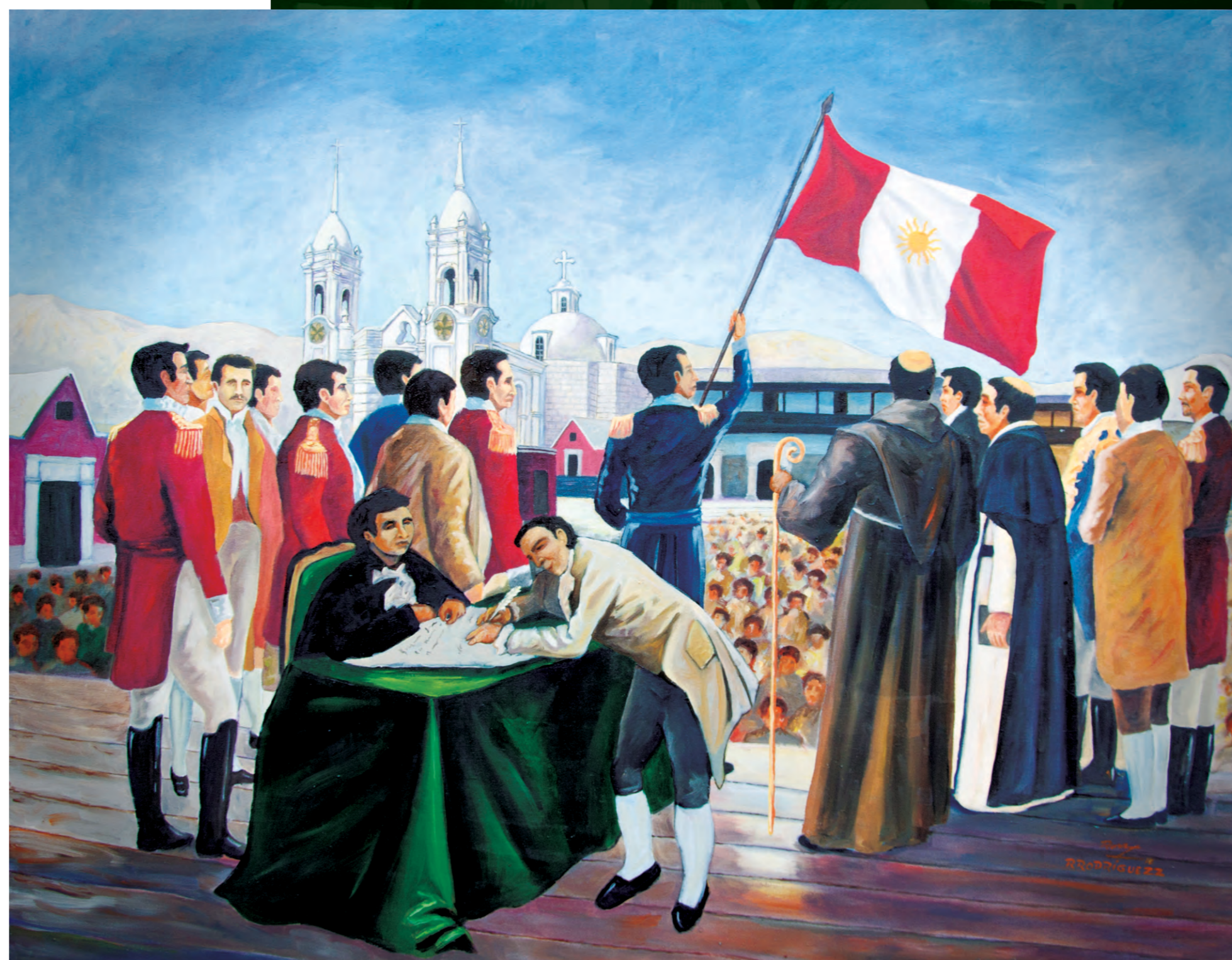
Segunda Proclama de la Independencia Ricardo Rodríguez Zambrano Óleo de 130 x 100 cm

Y a una sola voz el pueblo estalló en gozo; una danza de pañuelos y sombreros cubrió los cielos moqueguanos; la ciudad se arrojó de fiesta. Hubo Misa de Acción de Gracias. Por la tarde se ofreció un gran banquete para las autoridades; el vino y el aguardiente discurrió en jolgorio; ricos y pobres se unieron en un abrazo; las campanas no dejaron de declarar sus melodías. Los saraos se prolongaron por varios días.