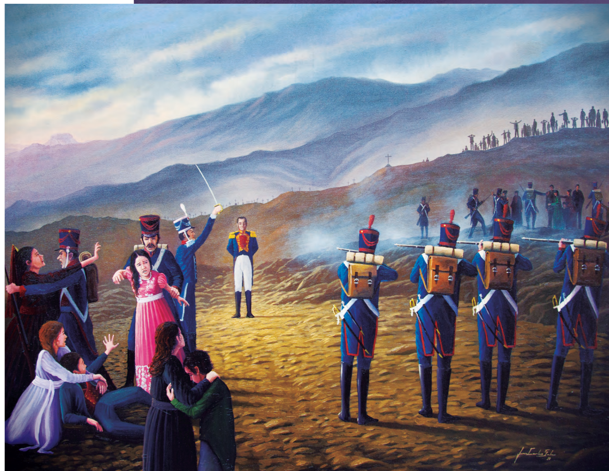
El fusilamiento de Bernardo Landa Juan Carlos Salas Condori Óleo de 130 x 100 cm

En 19 de enero de 1823 aconteció la Batalla de Torata; el ejército realista dio duro golpe a los patriotas a pesar de la resistencia, el ejército patriota se replegó hacia Samegua siendo alcanzado a la altura de Tombolombo y sucediéndose la Batalla de Moquegua el 21 de enero; los patriotas fueron cercados y derrotados y don Bernardo es tomado preso y ejecutado el mismo día; fue procesado en el Cabildo (hoy Casa Mariátegui) bajo el cargo de traición al Rey, tras el juicio sumario es conducido a la explanada del Huayco donde es fusilado heroicamente. Fue sepultado, según fuentes orales, en la propiedad que había adquirido de doña Elena Hurtado Zapata situada a un costado del Camino Real que lleva a Samegua.